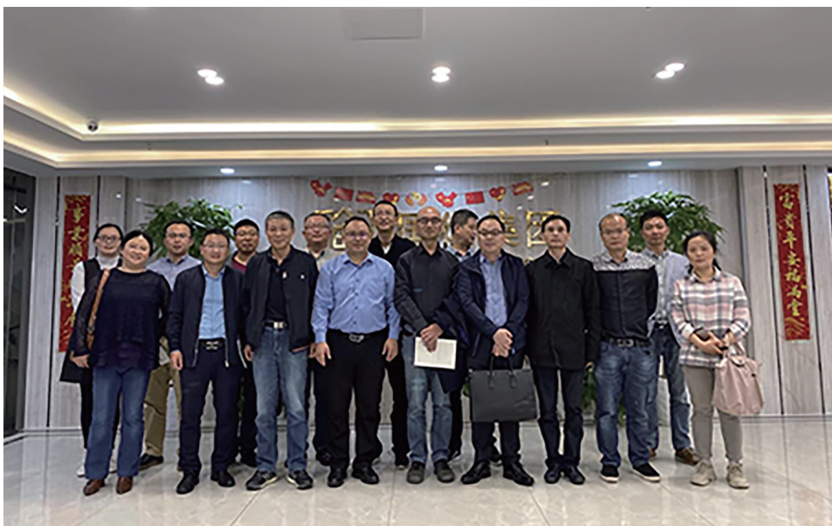
贵州省房地产业协会估价分会在江苏国衡土地房地产资产评估咨询有限公司交流考察